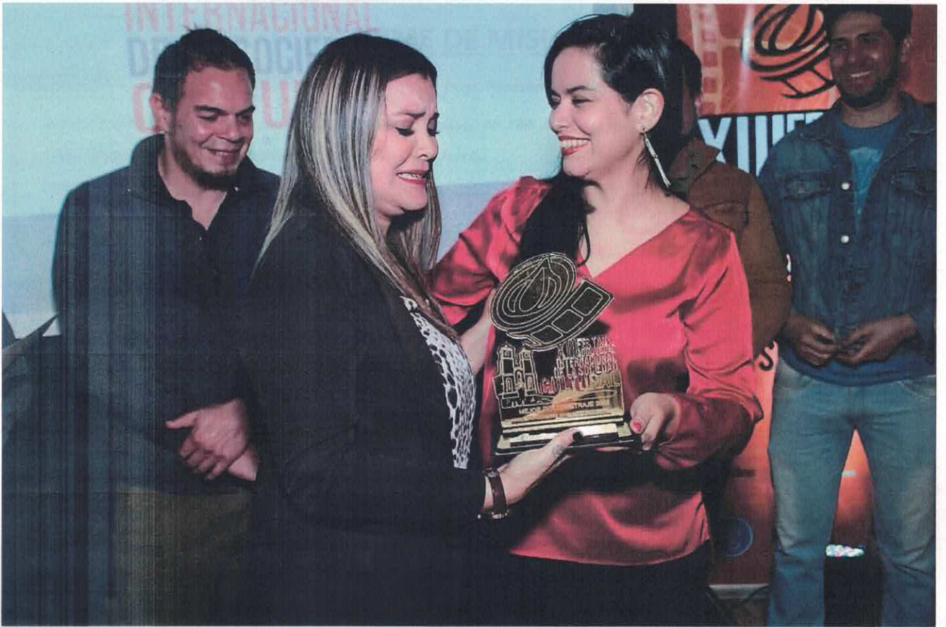
Entrega del premio a la mejor película en el Festival de Cine de la Universidad de la Costa.